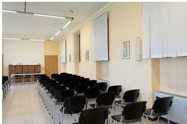
Punto Famiglia Circonvallazione Papa Giovanni II, 23 Caravaggio (BG)