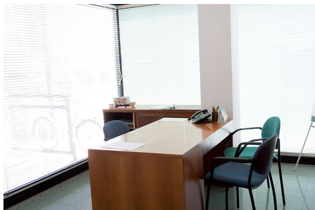
Centro Famiglia Via Pontirolo, 18/A Treviglio (BG)