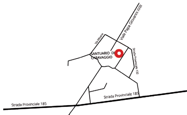
Punto Famiglia Circonvallazione Papa Giovanni II, 23 Caravaggio (BG)