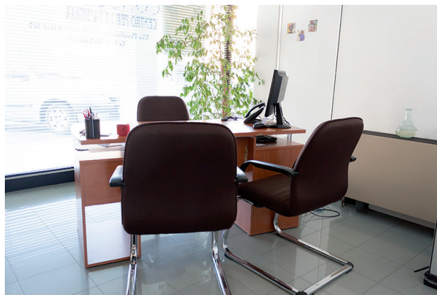
Centro Famiglia Via Pontirolo, 18/A Treviglio (BG)